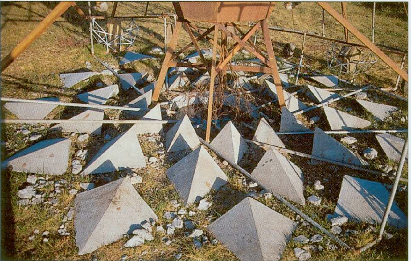
Niflheimur - Home of the dead