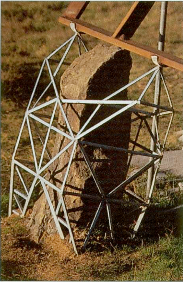
Dvergur - Dwarf